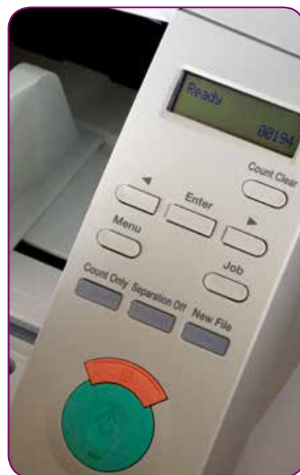
Panneau de commande convivial

Les modèles DR-G1100 et DR-G1130 offrent de nombreuses fonctionnalités intelligentes de traitement d'images, incluant le redressement avancé qui corrige les documents insérés en biais, MultiStream pour créer deux images avec des paramètres de numérisation différents par document numérisé pour, par exemple, améliorer la lisibilité de la reconnaissance optique de caractères.