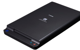
Unité de numérisation à plat A4 102